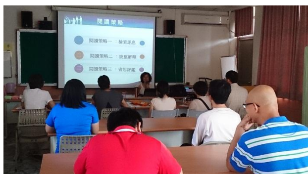
國文教師以外，資源班教師亦踴躍參與