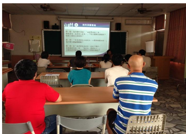
以實例解說閱讀策略運用，學員專注聆聽