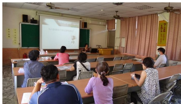
與會學員專注聆聽