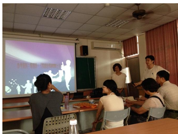
學員與講師意見交流