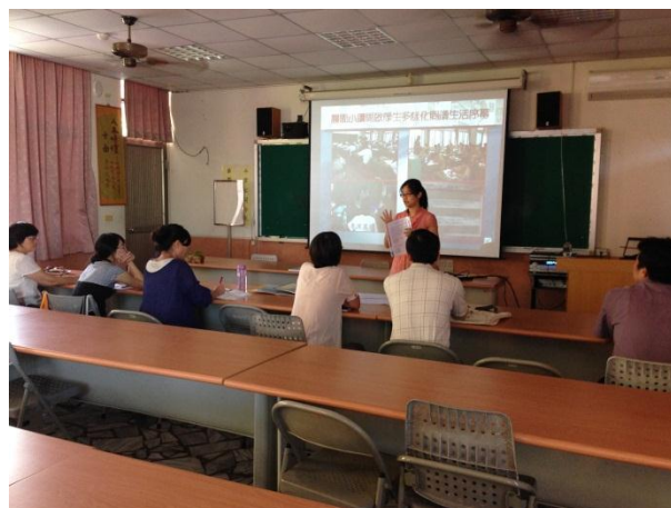
講師熱情分享多元閱讀活動

晨讀日誌撰寫須知 本日誌由服務股長負責採音、填寫，期是於前一週填寫並提交，並經導師簽名後，繳回教務處設備組。 每日晨讀時間 7:30-7:45(各班可自行彈性調整時間)，請服務股長到導師辦公室呈讀文章並領取晨讀文章，發給同學進行閱讀，晨讀結束後統一收回，整理整齊，請點數量，並歸還原晨讀文章資料夾。 各班應由導師、閱讀指導老師、國文老師及其他任課老師推薦、推薦，亦可選擇適合晨讀閱讀之文本，進行晨讀。如有教師推薦寶貴優良文章，可浮貼於日誌中，經由服務股長提供給各班晨讀閱讀參考。 每日晨讀時間結束後，請服務股長於晨讀日誌上勾選，需要填寫晨讀時間所進行之活動。「學生表現或心得感想」欄，經由服務股長填寫。(沒考慮不需填寫) 感謝您的付出與配合！