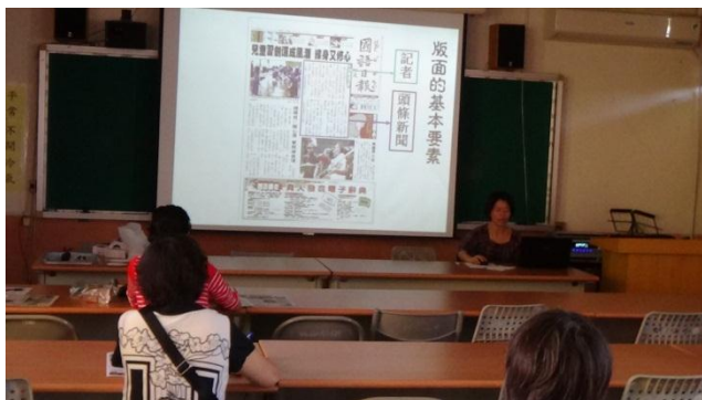
介紹報紙版面基本要素