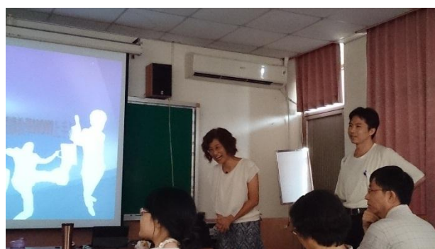
講師與學員愉快地意見交流