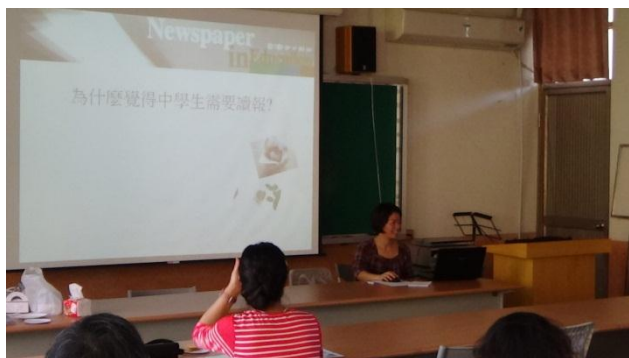
講師以提問開始引入課程