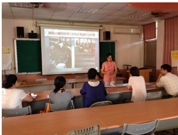
晨間小讀活動介紹