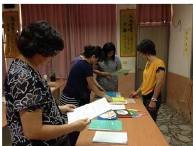
學員與講師欣賞學生作品並做意見交流