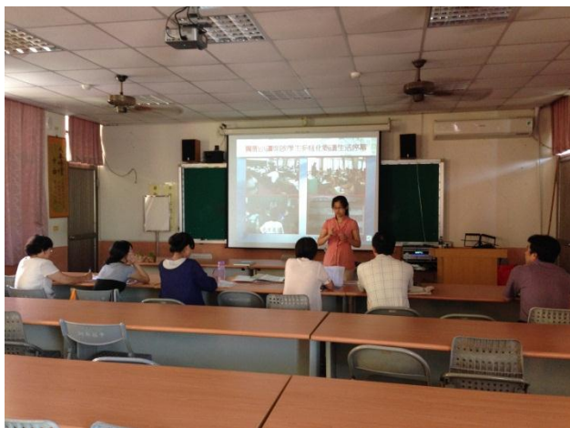
講師大方地與本校分享資源(服務股長職責)

晨讀日誌撰寫須知 本日誌由服務股長負責採音、填寫，期是於前一週填寫並提交，並經導師簽名後，繳回教務處設備組。 每日晨讀時間 7:30-7:45(各班可自行彈性調整時間)，請服務股長到導師辦公室呈讀文章並領取晨讀文章，發給同學進行閱讀，晨讀結束後統一收回，整理整齊，請點數量，並歸還原晨讀文章資料夾。 各班應由導師、閱讀指導老師、國文老師及其他任課老師推薦、推薦，亦可選擇適合晨讀閱讀之文本，進行晨讀。如有教師推薦寶貴優良文章，可浮貼於日誌中，經由服務股長提供給各班晨讀閱讀參考。 每日晨讀時間結束後，請服務股長於晨讀日誌上勾選，需要填寫晨讀時間所進行之活動。「學生表現或心得感想」欄，經由服務股長填寫。(沒考慮不需填寫) 感謝您的付出與配合！