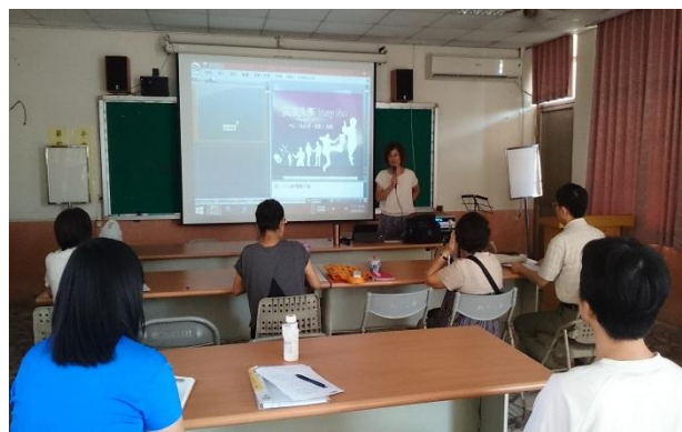
講師開場自我介紹