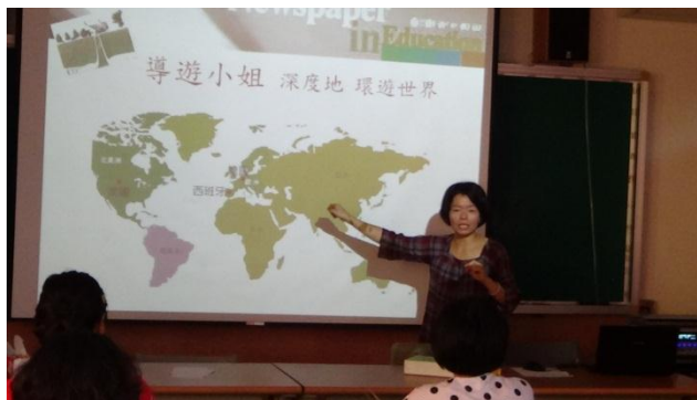
引起讀報興趣之活動