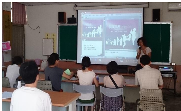
以朱自清「背影」為例，結合各種閱讀策略